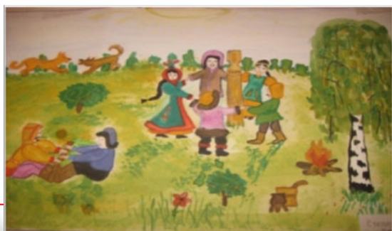
класса СОШ №35 г.Якутска «Якутский ысыах»

Участники экспедиции по итогам выполненных исследований каждый год принимают участие в различных научных и краеведческих конференциях. Проявляют творческие и лидерские способности: активно участвуют в концертах, проводят акции, организуют конкурсы, отражают жизнь, прожитую в экспедициях, через СМИ.